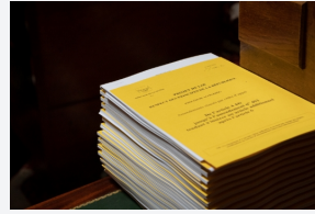
Contrôle et évaluation