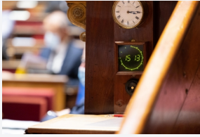
Dernières questions publiées