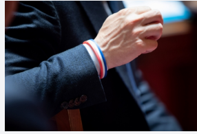
Réponses aux questions écrites : le palmarès des ministres